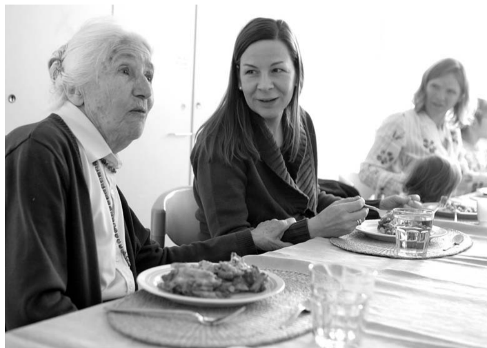
Menschen eine Heimat geben: Das »Haus der Familie« in Bad Godesberg.