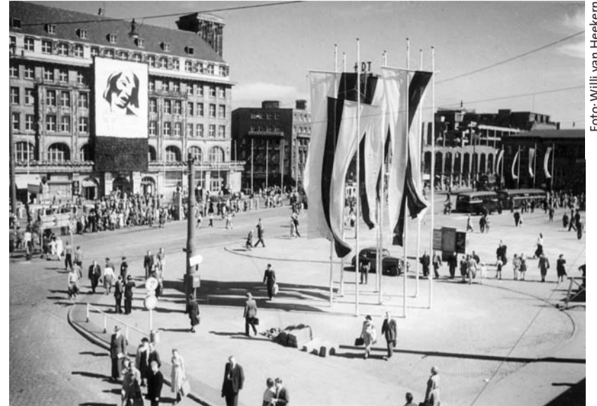
»Rettet den Menschen« lautete die Losung des ersten Kirchentags 1950 in Essen.

Anfang Dezember 1949, wieder im Königswinterer Adam-Stegerwald-Haus, kam es mit von Thadden zur Gründung der Evangelischen Akademie in Rheinland-Westfalen und zu einer Sitzung des Arbeitsausschusses für den Kirchentag. Die Vorbereitungen für den Kirchentag in Essen wurden dann mit fast allen Sitzungen im Rheinland durchgeführt. Von Essen aus organisierte von Thadden mit mehreren Besprechungen auch im Adam-Stegerwald-Haus in Königswinter die dauerhafte Einrichtung des Kirchentages. Mit dem rheinischen Bankier Dr. Fritz von Waldhausen wurde der erste Schatzmeister des Kirchentags gefunden. Die öffentliche Bedeutung wurde durch einen Empfang bei Bundespräsident Prof. Theodor Heuss am 30. März 1950 in Bonn und am gleichen Tag beim DGB-Vorsitzenden Hans Böckler in Düsseldorf unterstrichen. Besuche bei den im Aufbau