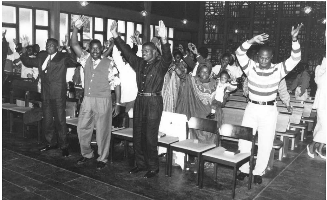
»Swing low, sweet chariot ...« – Afrikanischer Gottesdienst in der Bonner Trinitatiskirche.