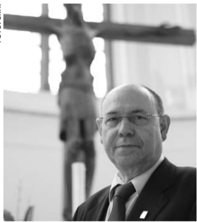
Präses Nikolaus Schneider: »Glauben lässt sich nicht widerspruchsfrei erklären«