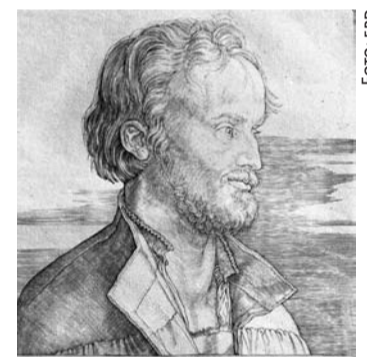
Philipp Melanchthon starb vor 450 Jahren

Dieser Ansatz erschloss auch neue Wege zum Studium der Bibel. Martin Luther, der als Kollege der Vorlesung bewohnte, war begeistert. Das Ereignis war der Beginn einer »wunderbaren Freundschaft«, die von einer intensiven Zusammenarbeit für die Reformation getragen war. Melanchthon unterstützte mit den »Loc communes« als protestantischer »Ur-Dogmatik« und dem »Augsburger Bekenntnis« die Identitätsfindung der protes-