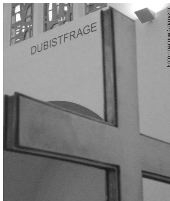
Das Kreuz fordert viele Fragen heraus. Schriftzug des Künstlers Babak Saed in der Bonner Lutherkirche