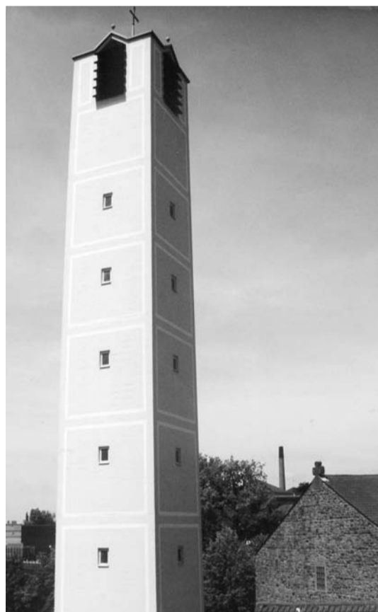
Die Lukaskirche auf der Grenze der historischen Bonner Stadtteile Altstadt und Castell.

■ Die Chronik ist erhältlich über das Evangelische Gemeindeamt in Beuel: Siegfried-Leopold-Str. 74, 53225 Bonn Tel. 02 28 / 46 64 82, E-Mail: gemeindeamt@ev-kirche-beuel.de