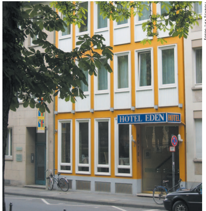
Das Paradies ist so nah: Das »Hotel Eden« am Bonner Hofgarten.

Das Hotel Garni verfügt über 25 Zimmer, zum Teil mit idylischem Blick auf den Hofgarten. Eine Übernachtung im Einzelzimmer ist ab 70 Euro möglich, eine Nacht im Doppelzimmer ab 85 Euro. Im Preis enthalten ist das Frühstücksbuffet, das im gemütlichen Frühstückssaal serviert wird. Engel wird man im Raumdekor allerdings vergeblich suchen, außer dem Namen erinnert in dem Hotel heute nichts mehr an den biblischen Bezug. »Den Namen wollten wir aber dennoch beibehalten«, erklärt Portier Zügner und lächelt wieder freundlich. »Eden« sei auch internationalen Gästen ein Begriff. »Das wirkt in unserer global vernetzten Welt vertrauenswürdig.«