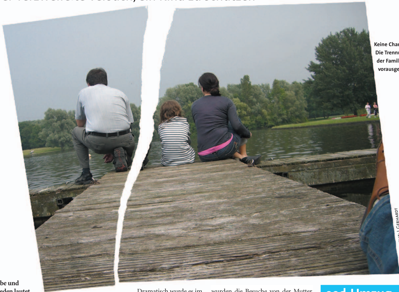
Keine Chance: Die Trennung der Familie war vorausgesagt.

Der verzweifelte Versuch, ein Kind zu schützen