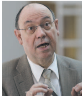
»Evangelische Kirche bleibt in Bonn präsent.«

PRO: Warum war eine Fusion am Bonner Standort nicht durchsetzbar?