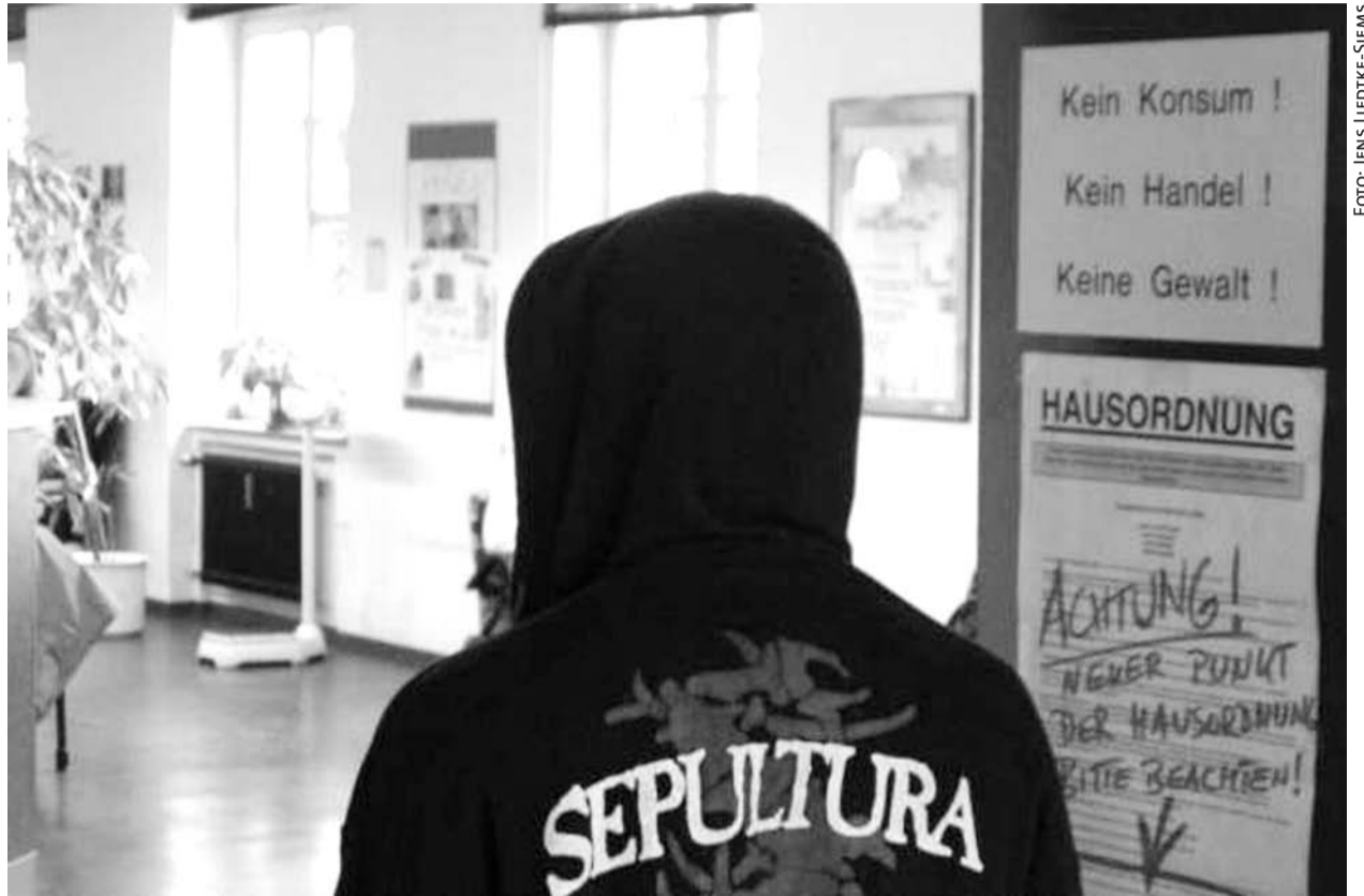
Klare Regeln im Café KoKo: »Kein Konsum, kein Handel, keine Gewalt!«

Eine alte Eingangstür, fades künstliches Licht im muffigen Treppenhaus. An der Tür deutliche Hinweise: Kein Handel! Keine Gewalt! – Hinter der Tür aber erwartet den Besucher eine freundliche Atmosphäre. Es gibt Kaffee und Kuchen, meist auch ein warmes Mittagessen, bequeme Stühle und Pflanzen. Seit 1991 hat das Café KoKo in der Troisdorfer Innenstadt an Werktagen von 12.30 bis 16.00 Uhr geöffnet. Es ist das Kontaktcafé für Drogenabhängige in Trägerschaft der Diakonie »An Sieg und Rhein«.