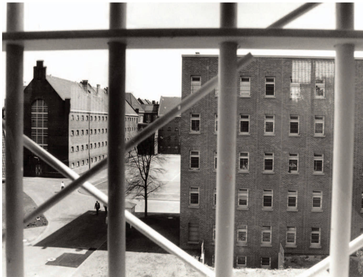
Oft ohne Hoffnung: Aussicht aus dem Gefängnis auf dem Brückberg.