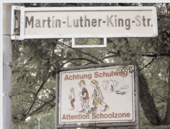
Ein Stück Stadtgeschichte im amerikanischen Viertel in Plittersdorf: Erinnerung an den evangelischen Prediger.

Voraussetzung für eine Benennung: Die Person muss ein Jahr verstorben sein und »einen Beitrag zur Geschichte Bonns oder seines Stadtteils geleistet haben«. Im Jahr werden in Bonn etwa fünf bis zehn Straßen oder Plätze neu benannt bzw. umbenannt.