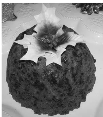
Eine süße Versuchung: christmas-pudding

Apropos Post: Jüngere Kinder schreiben ihre Wunschliste an »Father Christmas« in Lappland und schicken sie ab – unser Sohn hat in unserem ersten Jahr hier in Bonn sogar eine Antwort bekommen. Vom Weihnachtsmann selbst. Da muss die Deutsche Post dahinterstecken... Für die wahren Geschenke ist natürlich auch Father Christmas – also nicht das Christkind – zuständig. Die bringt er mit den Rentieren in der Nacht vom 24. zum 25. Dezember. Damit die sich stärken können, lassen wir normalerweise ein Glas Sherry und ein paar Karotten am Kamin liegen. Die kleineren Geschenke finden