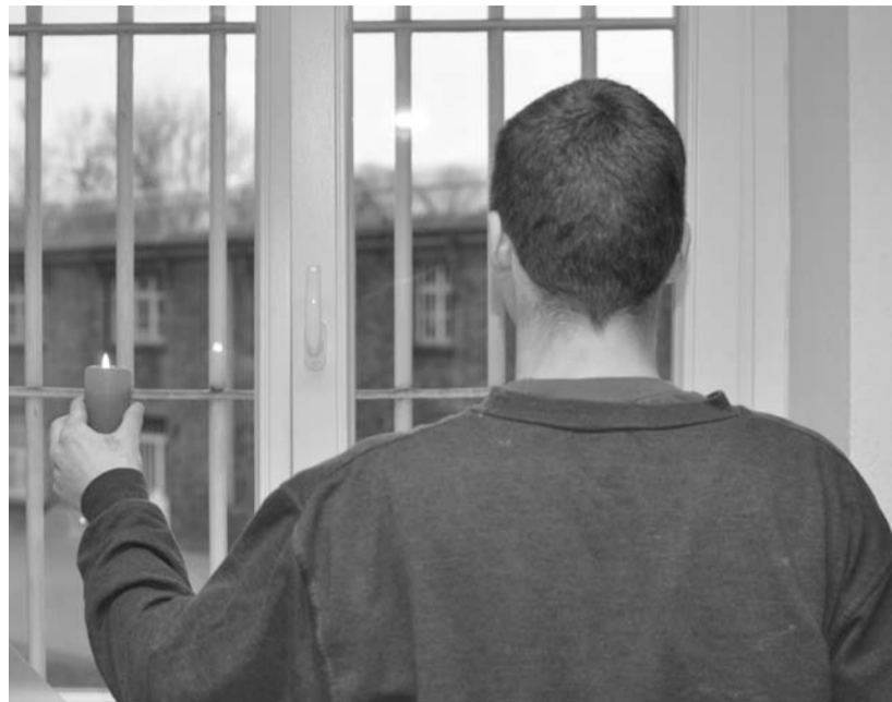
Weihnachten 2010: Blick aus dem Siegburger Gefängnis.