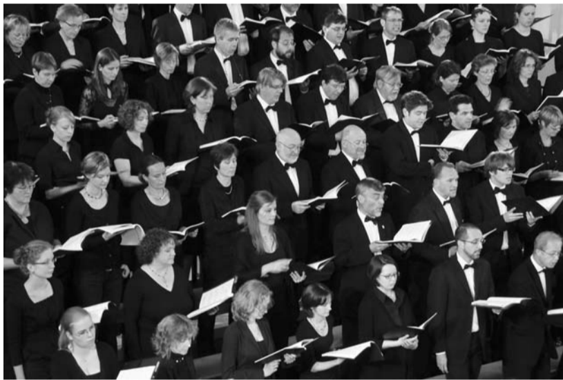
Präzise, anmutig und stimmungswaltig: die Kantorei der Bonner Kreuzkirche.

■ Alle Termine siehe Kirchenmusikskalender: www.bonn-evangelisch.de Redaktion: Ute Mentges/Susanne Ruge (info@bonn-evangelisch.de)