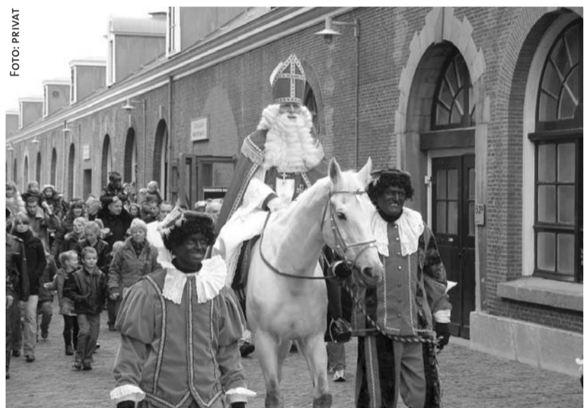
Hoch zu Ross: Einzug des Sinterklaas in einer niederländischen Stadt, der nach der Tradition mit dem Schiff aus Spanien kommt.

Ich werde von den Teilnehmern meiner Sprachkurse oft gefragt, wie in den Niederlanden Weihnachten gefeiert wird. Nun bin ich schon viele Jahre in Deutschland, habe hier studiert und meine Kinder groß gezogen. Ich feiere deshalb schon seit Jahrzehnten Weihnachten, wie es in Deutschland üblich ist. Dennoch erinnere ich mich gerne daran, wie es früher in meiner Kindheit in den Niederlanden war.