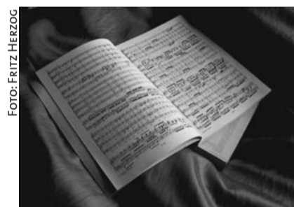
Da, wo sie hingehören: Die Kantaten des Weihnachtsoratoriums im Gottesdienst.

wurden: an den Weihnachtstagen, am Neujahr, am Sonntag nach Neujahr und am Epiphaniastag. Laut Pridik sind die Kantaten des Weihnachtsoratoriums »gottesdienstliche Musik«, die ihren Platz nach der Lesung des Evangeliums hat und in der Tradition der protestantischen Kirchenkantate eine »musikalische Predigt« über den Evangeliumstext darstelle. »Das möchten wir in Erinne-